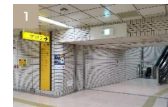
勾当台公園駅（2番出口）よりお進みください。