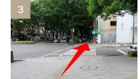
第一生命ビル前の横断歩道を直進してください。