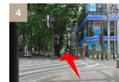
ローソン前の横断歩道を直進してください。