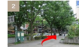
地上へ出たら、定禅寺通をそのまま直進してください。