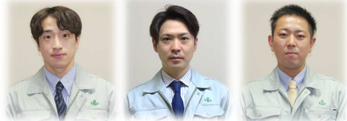
角田市実務研修生 登米市実務研修生 大河原町実務研修生

＜受入実績＞ 仙台市（旧宮城町）・角田市・登米市・栗原市（旧高清水町・瀬峰町）・東松島市（旧鳴瀬町）・大崎市（旧鳴子町）・大河原町・村田町・柴田町・七ヶ浜町・利府町・大和町・色麻町・宮城県環境事業公社