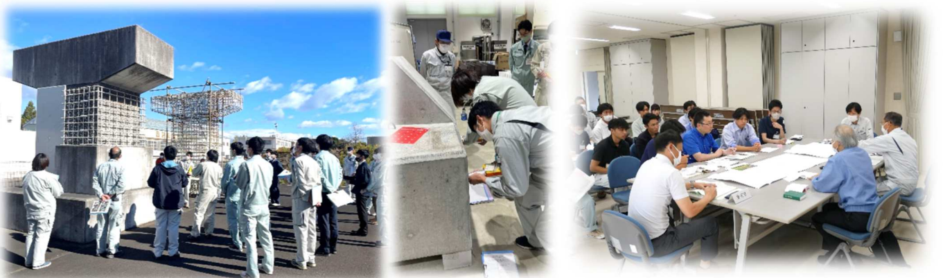
国土交通省 東北地方整備局 東北技術事務所 基礎研修（体験型実習／施工管理）