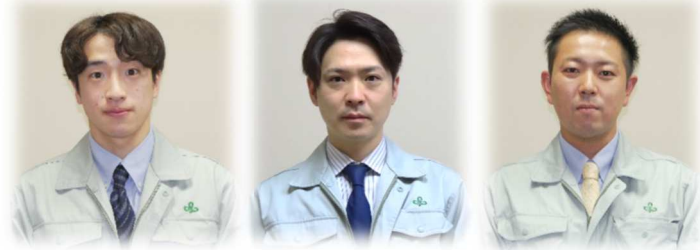
角田市実務研修生 登米市実務研修生 大河原町実務研修生

＜受入実績＞ 仙台市（旧宮城町）・角田市・登米市・栗原市（旧高清水町・瀬峰町）・東松島市（旧鳴瀬町）・大崎市（旧鳴子町）・大河原町・村田町・柴田町・七ヶ浜町・利府町・大和町・色麻町・宮城県環境事業公社