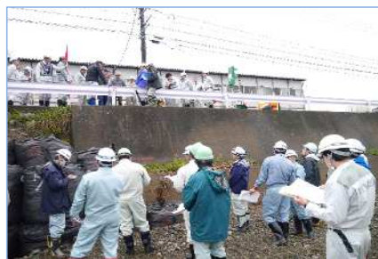
H30実施時～査定中 道路災害（河川脇）