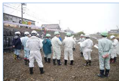
～査定後の振返り解説