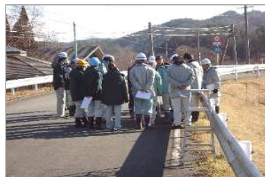
H29実施状況 河川災害